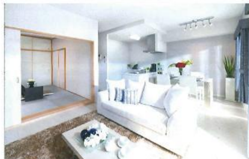
リビングダイニング ※画像は別住戸のイメージです。